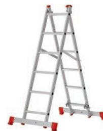
ЛПА 3-У Стремянка