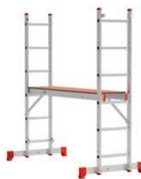
ЛПА 3-У Помост