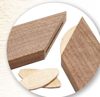
Точное и чистое ламельное соединение