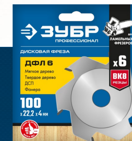
Упаковка: картонный конверт