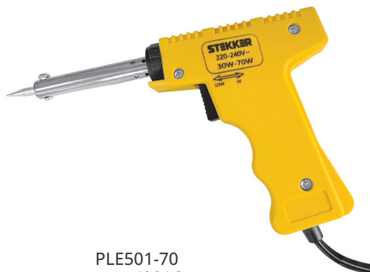
PLE501-70 арт. 49816