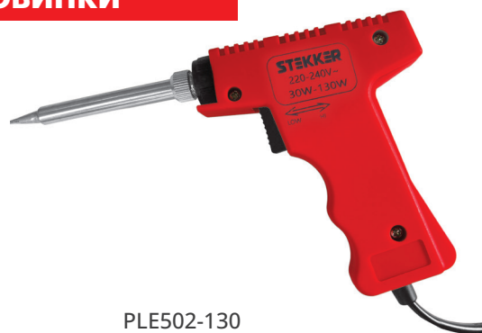
PLE502-130 арт. 49815