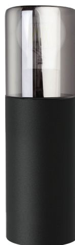
DH1803 арт. 51994