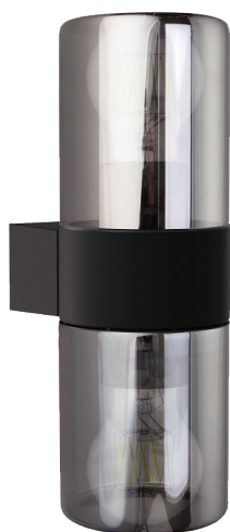
DH1802 арт. 51993