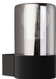
DH1801 арт. 51992