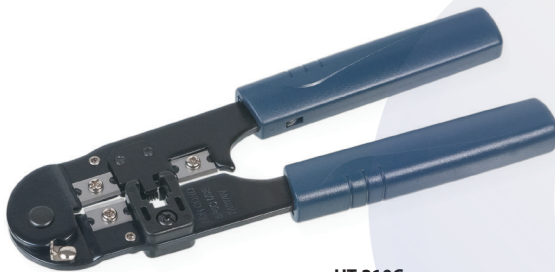
HT-210C (код для заказа 7827с)