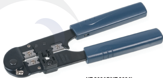
HT-2096C(HT-2096) (код для заказа 7826с)