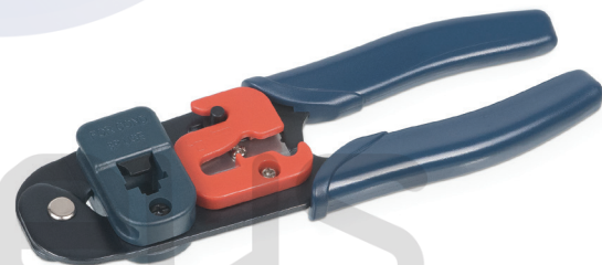
HT-L2180 (код для заказа 7831с)