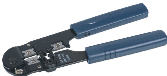
HT-2094 (код для заказа 7825с)