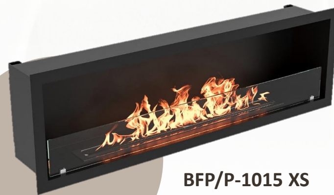
BFP/P-1015 XS HC-1573587