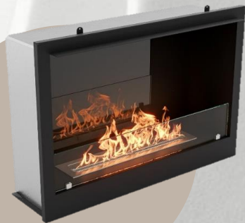
BFP/P-3020 | HC-1573589