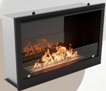
BFP/P-2520 | HC-1573588