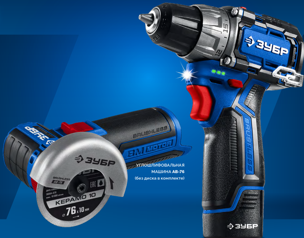
УГЛОШЛИФОВАЛЬНАЯ МАШИНА АВ-76 (без диска в комплекте)