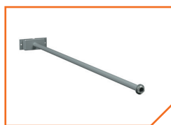
a331 Штанга BS-SH-1-30 Gray