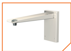
a333 Кронштейн BS-K-2 Gray