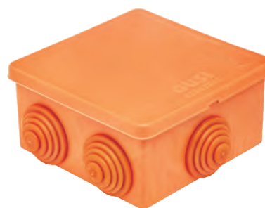
СЗВ76 Нг, оранжевый