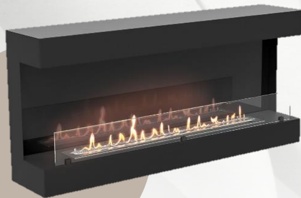
BFP/W-120 View | HC-1573599