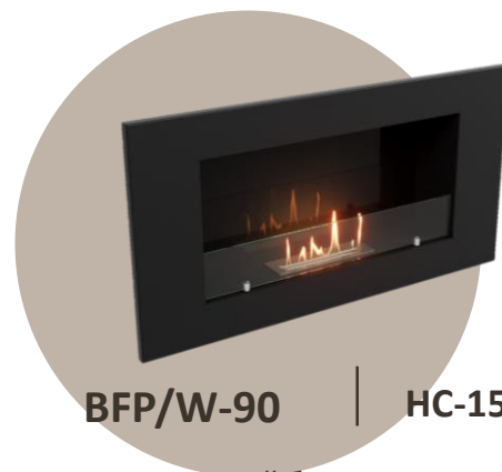
BFP/W-90 | HC-1573597