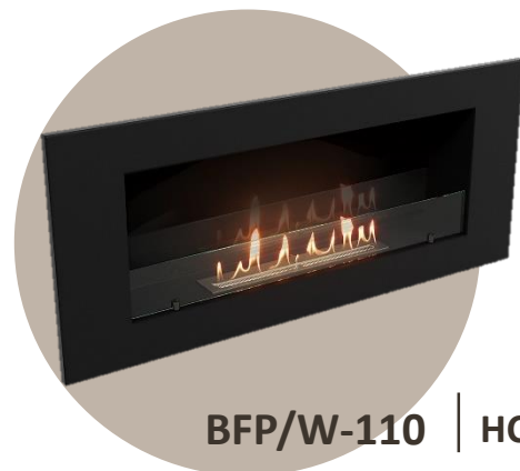
BFP/W-110 | HC-1573595