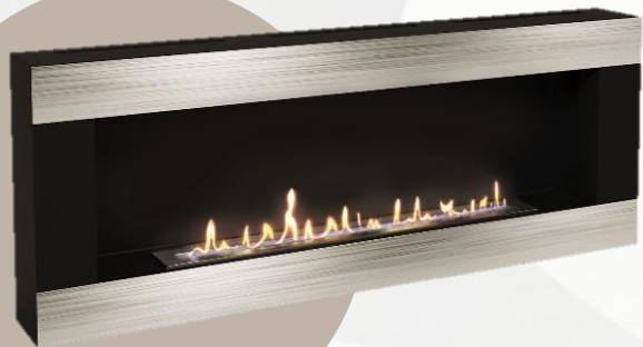
BFP/W-120 Silver | HC-1573596