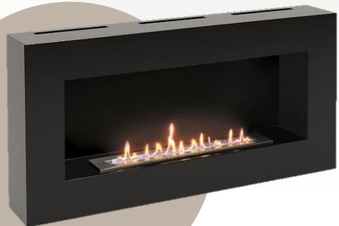
BFP/W-90 Black | HC-1573598