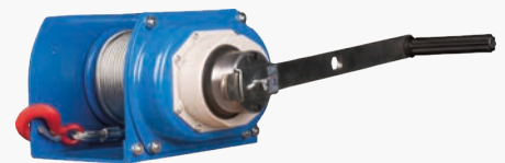
Барабанные лебедки GEARSEN JHW

Высота подъема: 10 - 20 м Грузоподъемность: 0.544 - 1.18 т