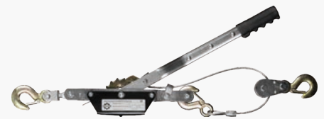
Рычажные лебедки GEARSEN GL

Высота подъема: 20 м Грузоподъемность: 0.8 - 5.4 т