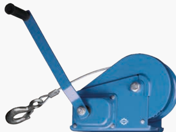
Барабанные лебедки с тормозом GEARSEN BHW

Высота подъема: 10 м Грузоподъемность: 0.544 - 1.18 т