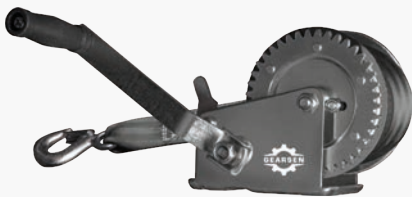
Барабанные лебедки (канат/лента) GEARSEN FD

Высота подъема: 3 м Грузоподъемность: 2 - 4 т