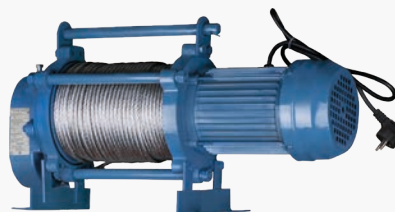
Канатные барабанные лебедки GEARSEN KCD

Высота подъема: от 35 - 100 м Грузоподъемность: 0.3 - 2.5 т Рабочее напряжение: 220/380 В