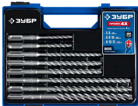
Упаковка: пластиковый бокс