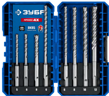
Упаковка: пластиковый бокс в блистере