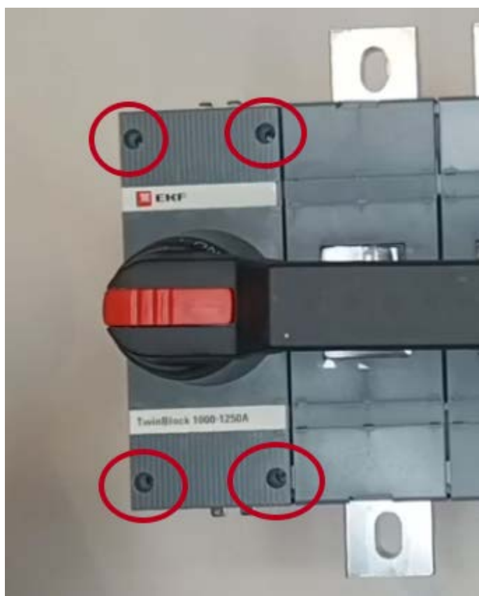
Винты для фиксации панели