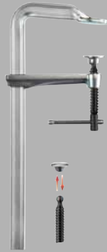
Фирменная цельнометаллическая струбица BESSEY GZ с Т-образной рукояткой