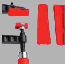
Ленточный защитный колпачок SKS (2 шт./пакет)