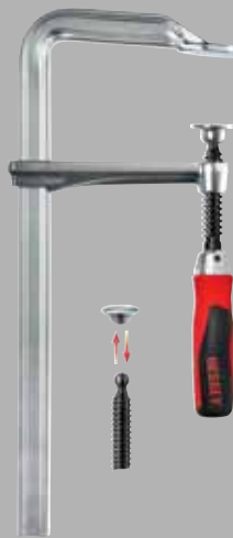
Фирменная цельнометаллическая струбица BESSEY GZ со складной рукояткой