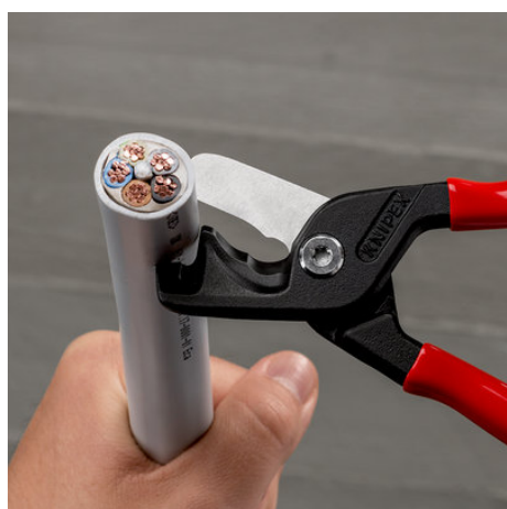
Ступенчатые режущие кромки предотвращают выскальзывание кабелей