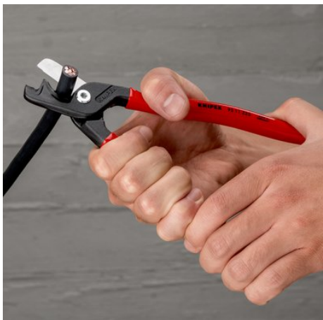
Форма рукоятки позволяет производить захват близко к шарниру с помощью одной руки