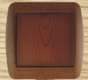
Античный махагон Antique Mahogan