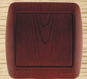
Античный кедр Antique Cedar