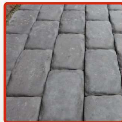
пол с препятствиями

рекомендовано использовать на гладких поверхностях могут повредить деликатные поверхности