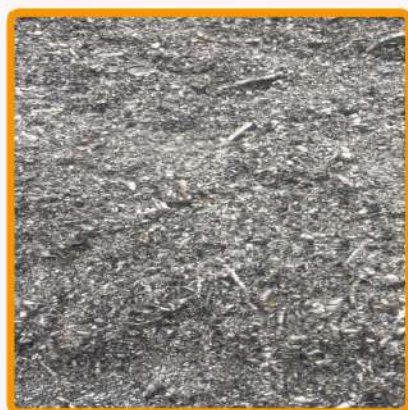
пол со стружкой