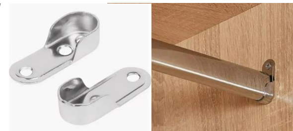
Настенный держатель. Представлен в ассортименте.