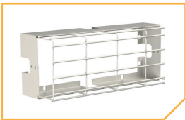
a2333 Решетка защитная BS-R-1