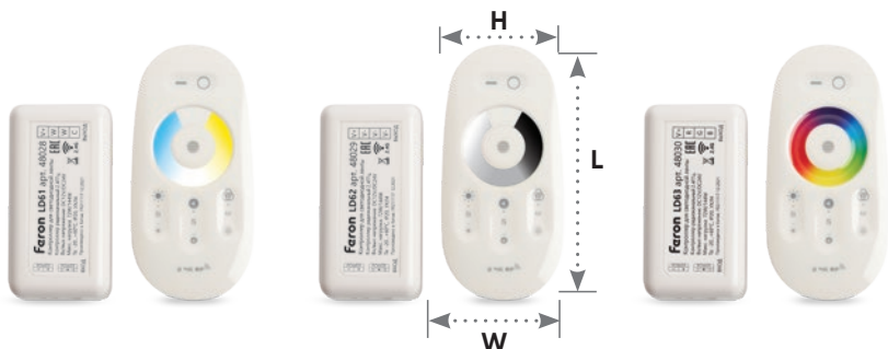
контроллер цветовой температуры для мультибелых лент