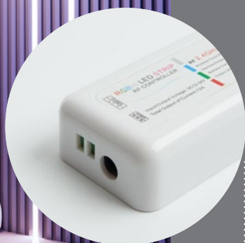
LD63 контроллер для управления режимами работы светодиодных лент

Трехканальный усилитель для монохромных и RGB светодиодных лент представляет из себя устройство, подключаемое в разрыв между отрезками ленты и позволяющее управлять одним контуром с помощью одного контроллера. Максимальный ток нагрузки составляет 24А (3x8А/CH), общая мощность подключаемой нагрузки 288Вт при используемом источнике питания с выходным напряжением 12В и 576Вт – при 24В.