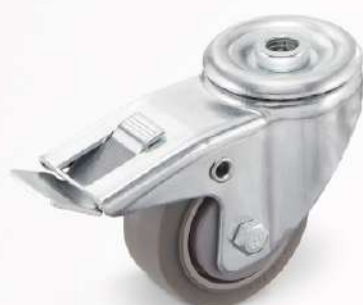
под болт с тормозом