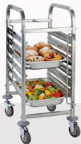
тележки для пунктов общественного питания