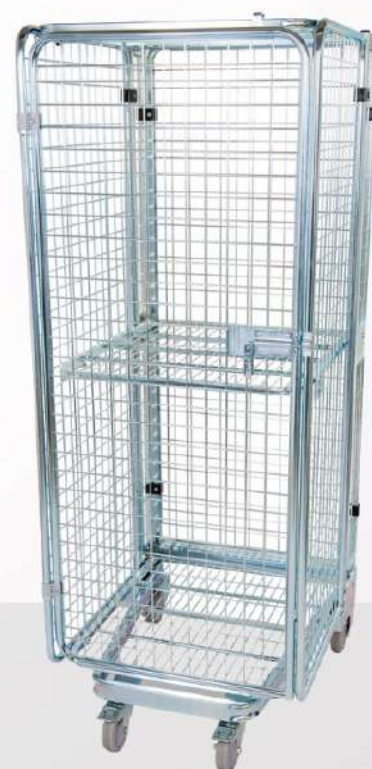
тележки для пищевой промышленности