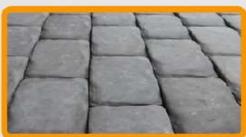
пол с препятствиями