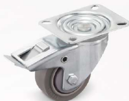
поворотное с тормозом