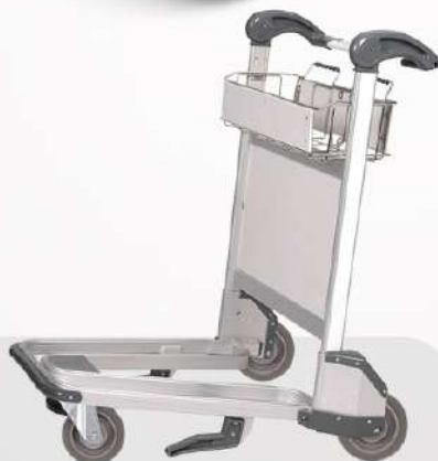
тележки для багажа