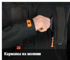
Карманы на молнии