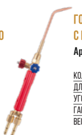
ГОРЕЛКА G2 ГАЗОСВАРОЧНАЯ АЦЕТИЛ. С ЦЕЛЬНОТЯНУТЫМИ НАКОН. Арт. 6528