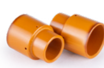
ДИФФУЗОР ГАЗОВЫЙ СВ50-70 Арт. 6312 аналог: PE0007