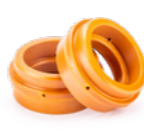
ДИФФУЗОР ГАЗОВЫЙ А101-151 ДЛЯ ДЛИННОГО СОПЛА Арт. 6305 аналог: PE0103