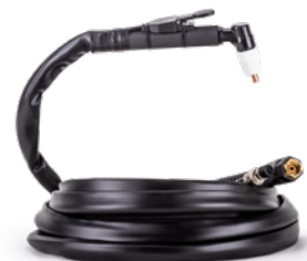
ПЛАЗМОТРОН РТ31 4М, М16, БЕЗ Ц. АДАПТЕРА Арт. 6296