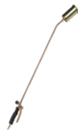
ГОРЕЛКА КРОВЕЛЬНАЯ ГАЗОВОЗДУШНАЯ ГВП-1000Р, Д.60 Арт. 5906