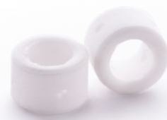
ДИФФУЗОР ГАЗОВЫЙ РТ31 Арт. 6301