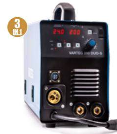
VAREG 200 DUO-S Арт. 7152

автоматическая настройка режимов работы работа от 130 В работа без остановки ПВ: 100%