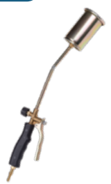
ГОРЕЛКА КРОВЕЛЬНАЯ ГАЗОВОЗДУШНАЯ ГВП-500Р, Д.60 Арт. 5901