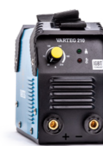
VAREG 210 | 230 | 250 Арт. 5893 | 5264 | 5266

стабильная работа при пониженном напряжении ПВ: 100% для профессионалов