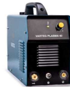
PLASMA 40 Арт. 6155