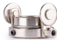
НАСАДКА РОЛИКОВАЯ СВ50 Арт. 6311 аналог: CV0037