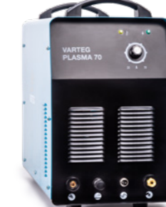
PLASMA 70 | 100 | 120 Арт. 6156 | 6157 | 6158