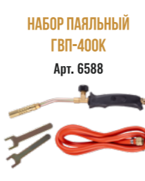
НАБОР ПАЯЛЬНЫЙ ГВП-400К Арт. 6588

ГОРЕЛКА КЛЮЧ - 2 ШТ. ШЛАНГ -1.5 М С СОЕД. ГАЙКАМИ