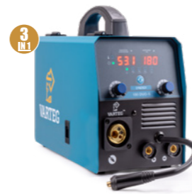
VAREG 180 DUO-S Арт. 8655