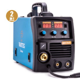
VAREG 200 DUO Арт. 6562

автоматическая настройка режимов работы работа от 150 В разъем для Spool Gun байонет 35-50 мм