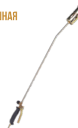
ГОРЕЛКА КРОВЕЛЬНАЯ ГАЗОВОЗДУШНАЯ ГВД-1000Р, Д.60 Арт. 5914