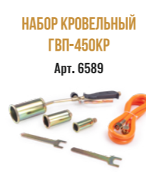
НАБОР КРОВЕЛЬНЫЙ ГВП-450КР Арт. 6589

ГОРЕЛКА КЛЮЧ - 2 ШТ. ШЛАНГ -1.5 М С СОЕД. ГАЙКАМИ