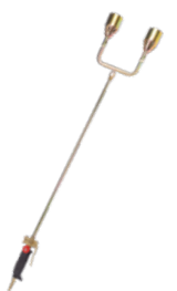
ГОРЕЛКА КРОВЕЛЬНАЯ ГАЗОВОЗДУШНАЯ ГVK2-1050Р, Д.50 Арт. 5921