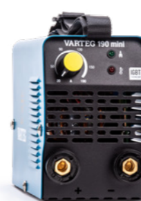
VAREG 190 MINI Арт. 5601