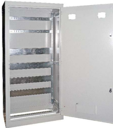
Корпус ВРУ-1 Узла 004/005