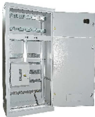
Корпус ВРУ 1-21-10 Узла