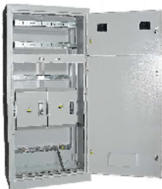
Корпус ВРУ 1-11-10 Узла