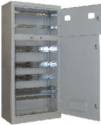
Корпус ВРУ-1 Узла 002*