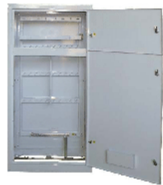
Корпус ВРУ 1-47-00 Узла