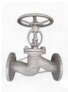
КЛАПАН ЗАПОРНЫЙ (ВЕНТИЛЬ) ФЛАНЦЕВЫЙ (15С65НЖ) РУ 1,6 МРА (16КГС/СМ2)