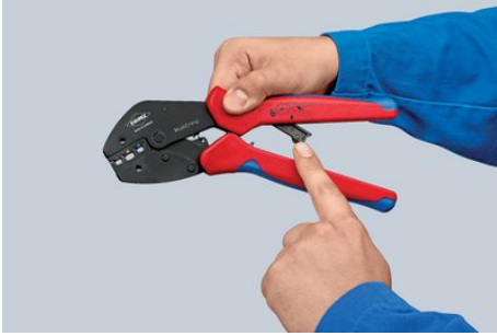
Задвиньте вспомогательный рычаг и сожмите клещи до отказа - устройство готово к применению