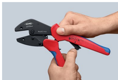
Сменное положение: раскрытие сервисного рычага для параллельного расположения губок