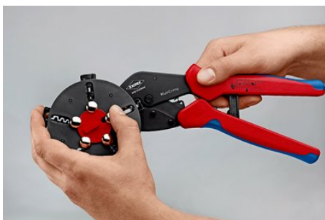
Смена профилей опрессовки: разблокируйте положение магазина, выньте профиль опрессовки из клещей