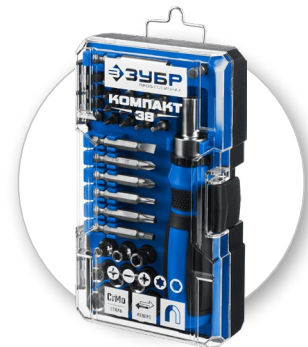
Ударопрочный кейс с надежным фиксатором