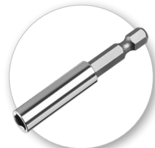
Адаптер для использования бит с шурупвертом