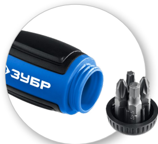
Хранение бит в рукоятке