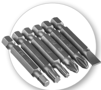
Удлиненные биты 50 мм с магнитными наконечниками для использования с шурупвертом