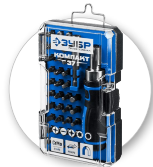
Ударопрочный кейс с надежным фиксатором