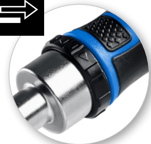
Реверсивный храповой механизм