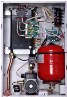
Внутренний вид котла Nobby Electro KBO