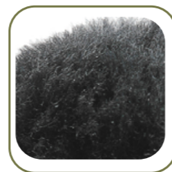
ПОДКЛАДКА: нат. мех