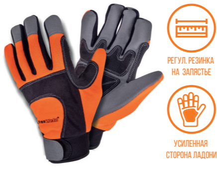
FOXWELD «МУСТАНГ» KC-03 Арт. 7778

РАЗМЕР 10/XXL МАТЕРИАЛ ЛАДОНИ / ТЫЛЬНОЙ СТОРОНЫ КОЗЬЯ КОЖА ПОДКЛАД НЕТ