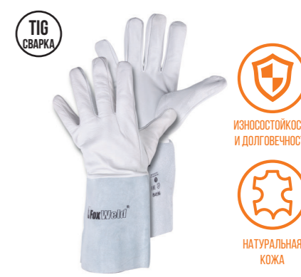
FOXWELD «ЕВРО» SA-08 Арт. 8496

РАЗМЕР 11/XXL МАТЕРИАЛ ЛАДОНИ / ТЫЛЬНОЙ СТОРОНЫ КОРОВИЙ СПИЛОК ПОДКЛАД ТВИЛЬ + ФАНЕЛЬ