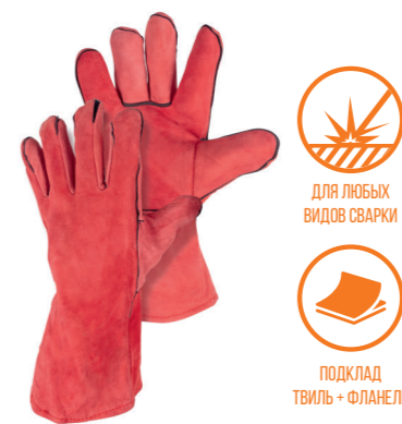
FOXWELD КРАСНЫЕ Арт. 6324/5949

РАЗМЕР 11/XXL МАТЕРИАЛ ЛАДОНИ / ТЫЛЬНОЙ СТОРОНЫ КОРОВИЙ СПИЛОК ПОДКЛАД ТВИЛЬ + ФАНЕЛЬ