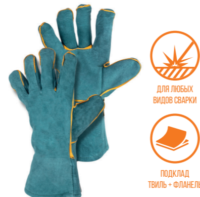
FOXWELD ЗЕЛЕННЫЕ Арт. 6323/6114

РАЗМЕР 11/XXL МАТЕРИАЛ ЛАДОНИ / ТЫЛЬНОЙ СТОРОНЫ КОРОВИЙ СПИЛОК ПОДКЛАД ТВИЛЬ + ФАНЕЛЬ