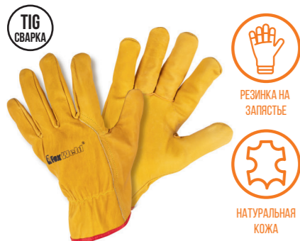
FOXWELD «МИНЬОН» SA-04 Арт. 7771

РАЗМЕР 10/XXL МАТЕРИАЛ ЛАДОНИ / ТЫЛЬНОЙ СТОР. КОРОВИЙ СПИЛОК/КОЖА БУЙВОЛА ПОДКЛАД НЕТ