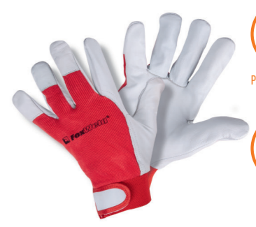
FOXWELD «СПАРТА» P-01 Арт. 7767

РАЗМЕР: 10/XL МАТЕРИАЛ ЛАДОНИ/ТЫЛЬНОЙ СТОРОНЫ: КОЖА БУЙВОЛА/СИНТЕТИКА ПОДКЛАД: НЕТ