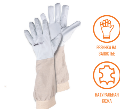
FOXWELD «ЛОНГЕР» SA-10 Арт. 7779

РАЗМЕР 9,5/L МАТЕРИАЛ ЛАДОНИ / ТЫЛЬНОЙ СТОРОНЫ КОЗЬЯ КОЖА / СИНТЕТИКА ПОДКЛАД НЕТ