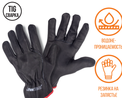
FOXWELD «ПАНТЕРА» SA-07 Арт. 7776

РАЗМЕР 9,5/L МАТЕРИАЛ ЛАДОНИ / ТЫЛЬНОЙ СТОРОНЫ РЕЗИНА / СИНТЕТИКА ПОДКЛАД НЕТ