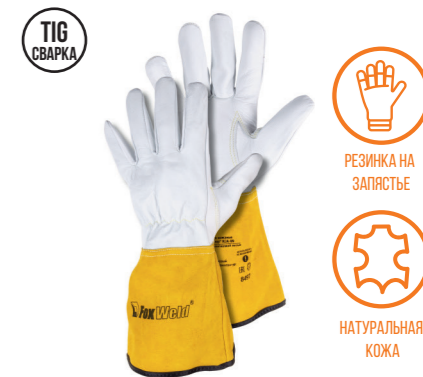
FOXWELD «ВЕКТОР» KCA-09 Арт. 8497

РАЗМЕР 10/XXL МАТЕРИАЛ ЛАДОНИ / ТЫЛЬНОЙ СТОР. КОЗЬЯ КОЖА/КОРОВИЙ СПИЛОК ПОДКЛАД НЕТ