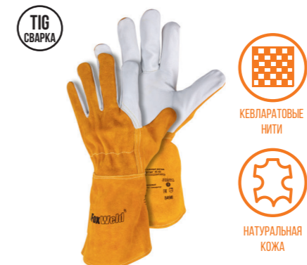
FOXWELD «МУСТАНГ» KC-03 Арт. 8498

РАЗМЕР 11/XXL МАТЕРИАЛ ЛАДОНИ / ТЫЛЬНОЙ СТОР. КОЗЬЯ КОЖА/КОРОВИЙ СПИЛОК ПОДКЛАД НЕТ