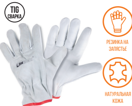
FOXWELD «АЗИЯ» SA-01 Арт. 7774

РАЗМЕР 10/XXL МАТЕРИАЛ ЛАДОНИ / ТЫЛЬНОЙ СТОР. КОРОВИЙ СПИЛОК/КОЖА БУЙВОЛА ПОДКЛАД НЕТ