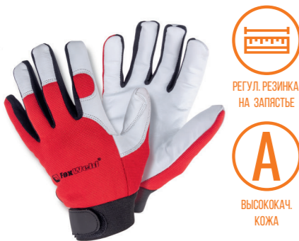
FOXWELD «ПРОФ» KC-01 Арт. 7770

РАЗМЕР 11/XXL МАТЕРИАЛ ЛАДОНИ / ТЫЛЬНОЙ СТОР. КОРОВ. КОЖА-СПИЛОК / КОРОВ.КОЖА ПОДКЛАД НЕТ