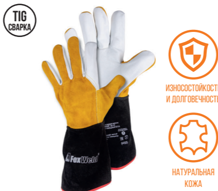
FOXWELD «ПРОФ» KC-01 Арт. 8495

РАЗМЕР 10/XXL МАТЕРИАЛ ЛАДОНИ / ТЫЛЬНОЙ СТОРОНЫ КОЗЬЯ КОЖА ПОДКЛАД НЕТ