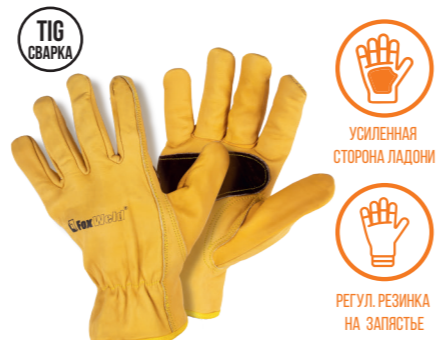
FOXWELD «ТИГР» SA-06 Арт. 7775

РАЗМЕР 10/XXL МАТЕРИАЛ ЛАДОНИ / ТЫЛЬНОЙ СТОР. КОЖА БУЙВОЛА/КОРОВИЙ СПИЛОК ПОДКЛАД НЕТ