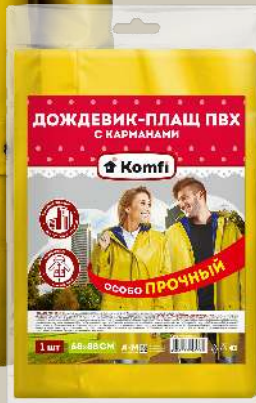
Двухслойный дождевик-куртка из ПВХ (PVC) жёлтый с карманами