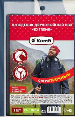
Дождевик-плащ «EXTREME» ПВХ двухслойный, синий+серебро