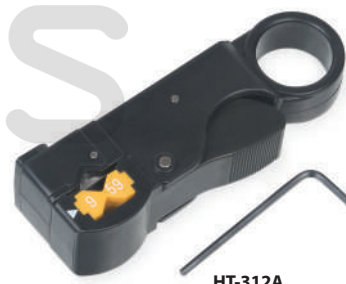
HT-312A (код для заказа 7819c)