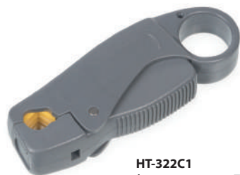
HT-322C1 (код для заказа 7822c)