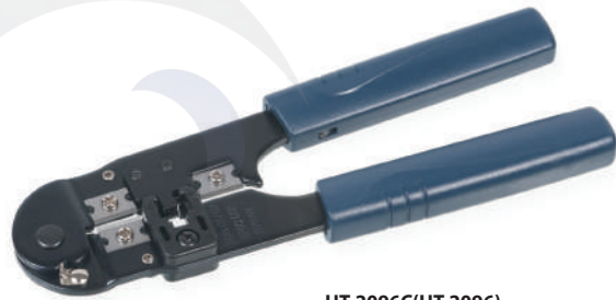
HT-2096C (HT-2096) (код для заказа 7826с)