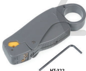
HT-322 (код для заказа 7821c)