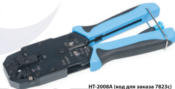
HT-2008A (код для заказа 7823с)