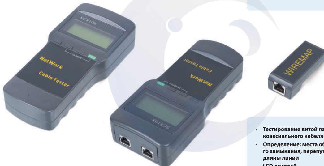
CT-LCD-RJ45 (код для заказа 7924с)