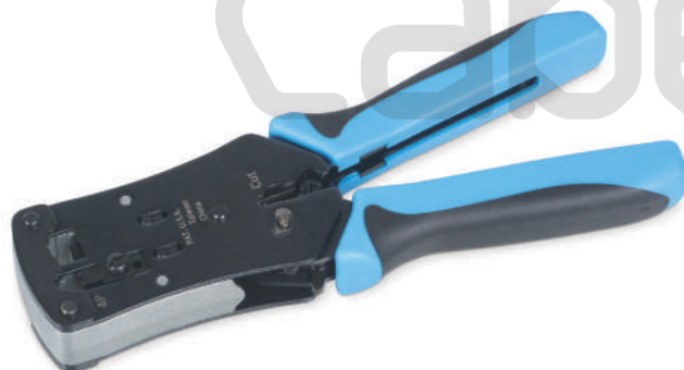
HT-N468B (код для заказа 7833с)