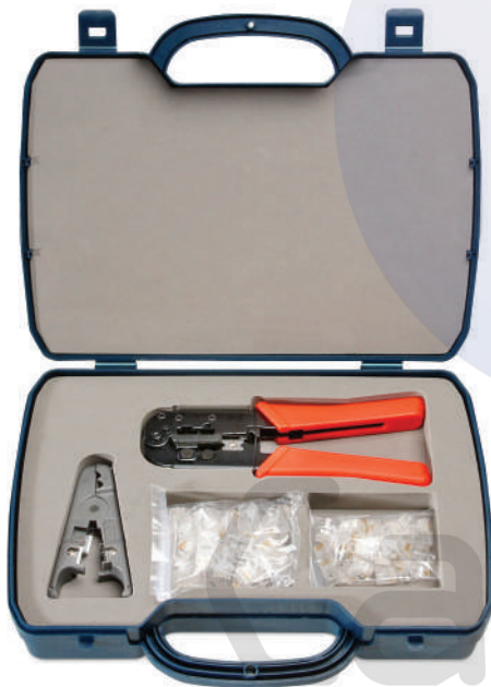
HT-2568A (код для заказа 7918c)