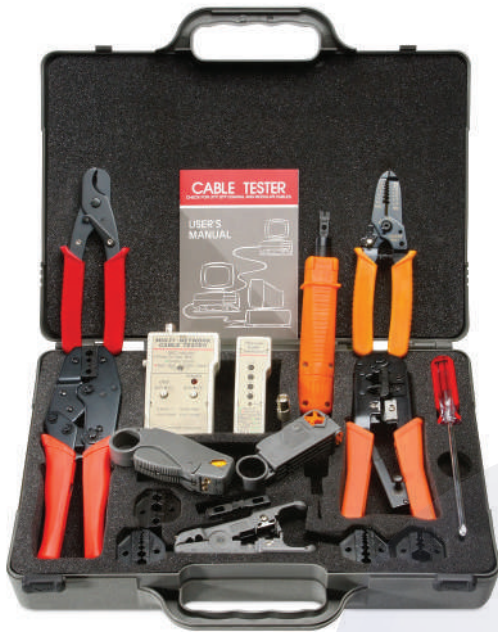
HT-4015 (код для заказа 7854с)