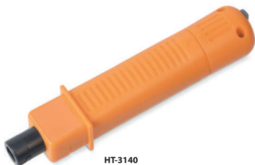
HT-3140 (код для заказа 7841с) / ударный