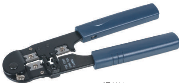
HT-2094 (код для заказа 7825с)