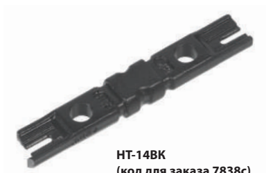
HT-14BK (код для заказа 7838с)