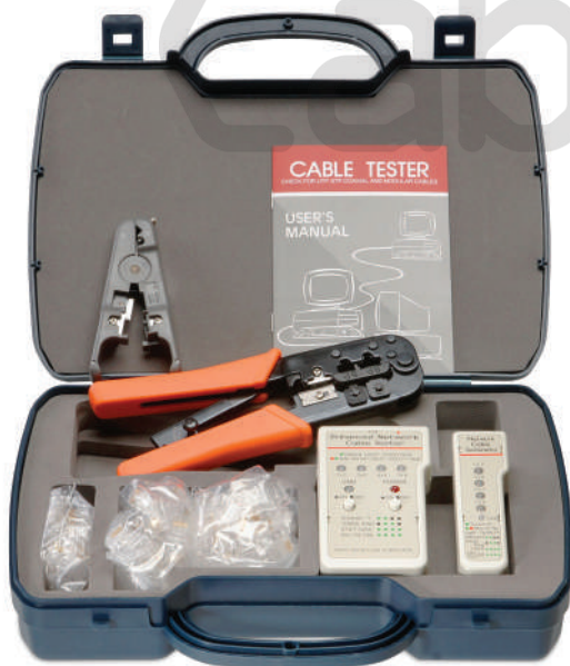
HT-2568G (код для заказа 7853с)