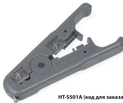
HT-S501A (код для заказа 7855c)