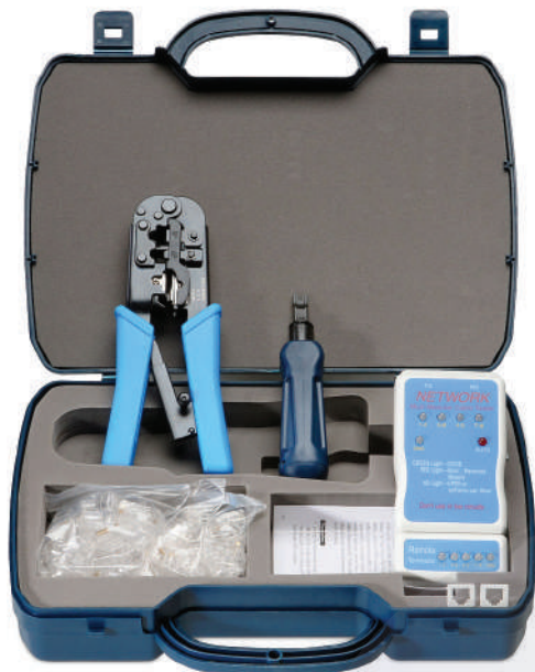
HT-K3044 (код для заказа 7852с)