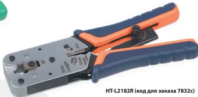
HT-L2182R (код для заказа 7832с)