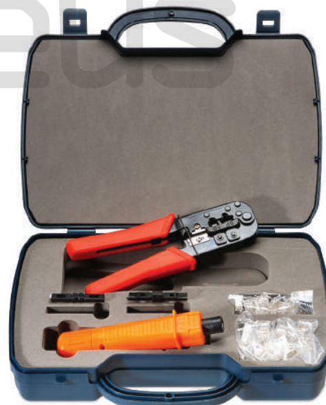
HT-2568E (код для заказа 7920c)