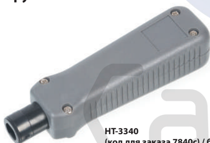
HT-3340 (код для заказа 7840с) / безударный