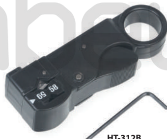
HT-312B (код для заказа 7820c)