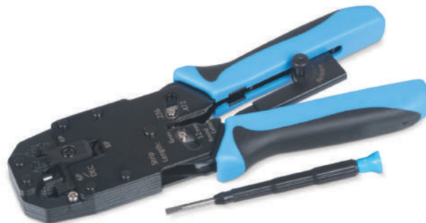
HT-2008AR (код для заказа 7824с)