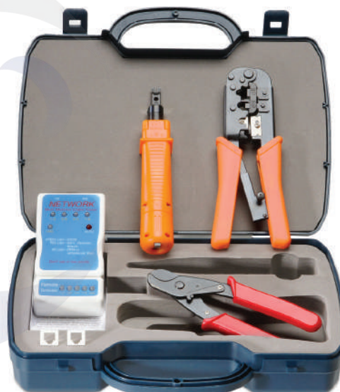
HT-K3043 (код для заказа 7851с)