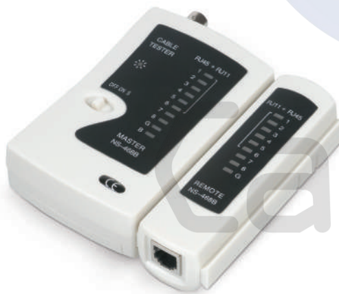
CT-BNC-RJ45 (код для заказа 7020с)