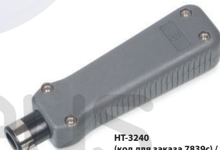
HT-3240 (код для заказа 7839с) / ударный