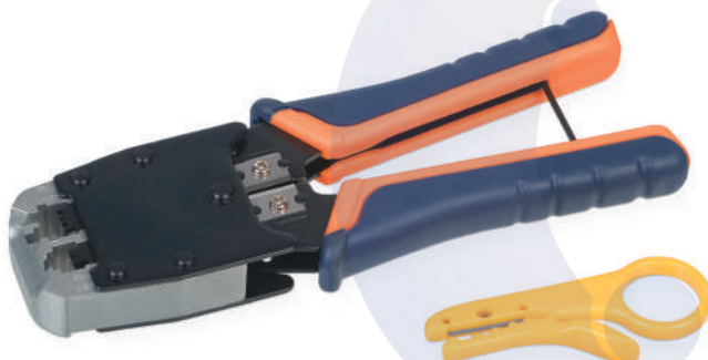
HT-500 (код для заказа 7829с)