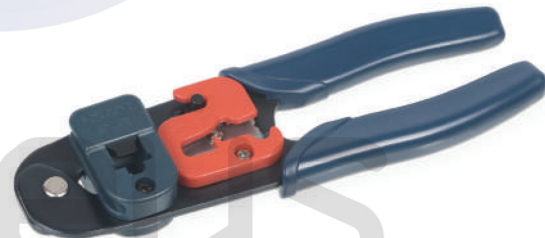
HT-L2180 (код для заказа 7831с)