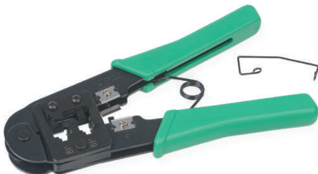
HT-268 (код для заказа 7828с)