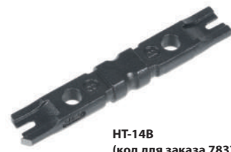
HT-14B (код для заказа 7837с)