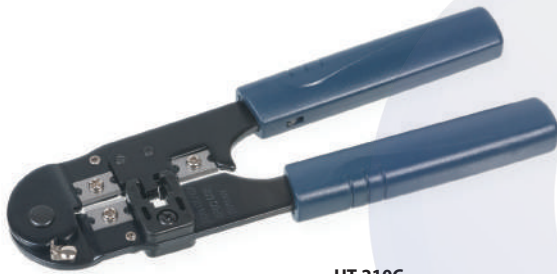
HT-210C (код для заказа 7827с)