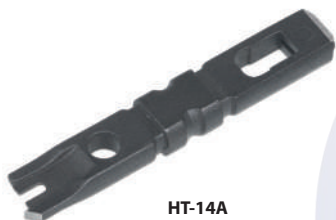
HT-14A (код для заказа 7836с)