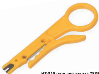
HT-318 (код для заказа 7835c)