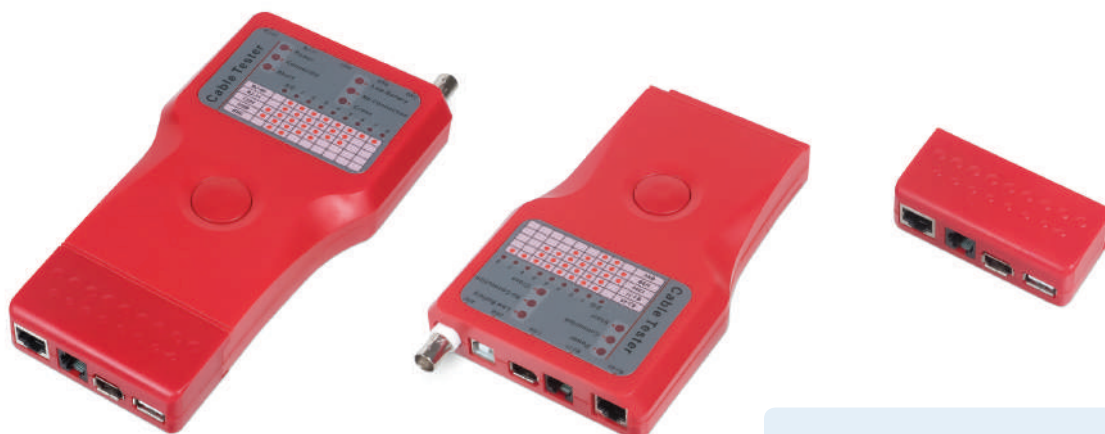
CT-SLT-5-1 (код для заказа 7923с)