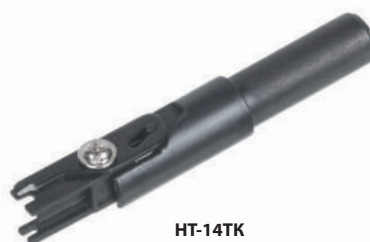
HT-14TK (код для заказа 7844с)