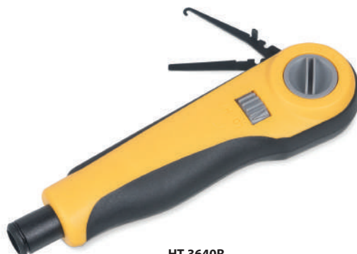
HT-3640R (код для заказа 7845с) / ударный