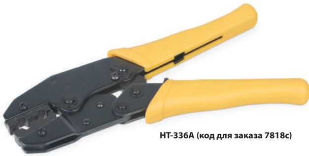
HT-336A (код для заказа 7818с)