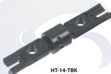
HT-14-TBK (код для заказа 7843с)