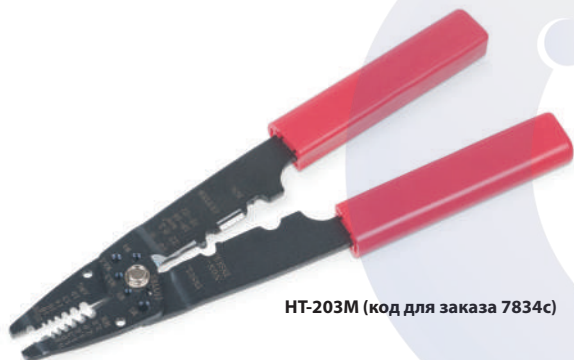
HT-203M (код для заказа 7834c)