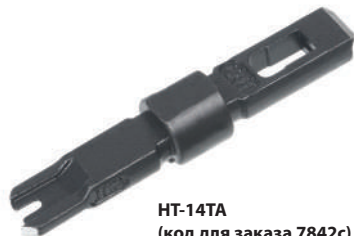
HT-14TA (код для заказа 7842с)