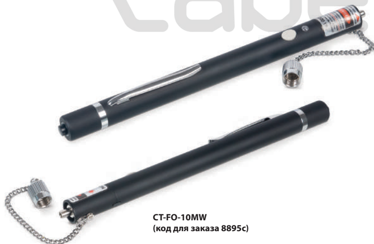
CT-FO-10MW (код для заказа 8895с)