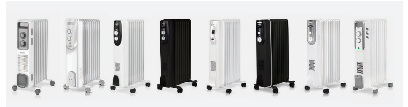
GREAT NEW EXPLORER NEW CLASSIC CLASSIC BLACK COMFORT MODERN LEVEL CUBE