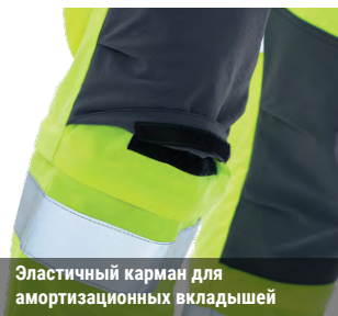
Эластичный карман для амортизационных вкладышей