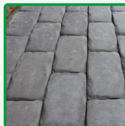
пол с препят- ствиями

возможно использование на любых поверхностях в помещении и на улице