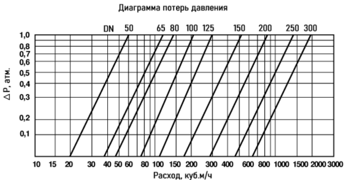
Диаграмма потерь давления в полностью открытом регуляторе

Потери давления при прохождении рабочей среды через регулятор могут быть определены по диаграмме: