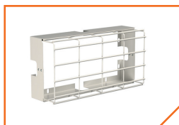
a2333 Решетка защитная BS-R-1