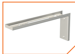
a4086 Кронштейн BS-K-3

(для крепления перпендикулярно плоскости стены)