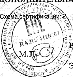
Схема сертификации: 2