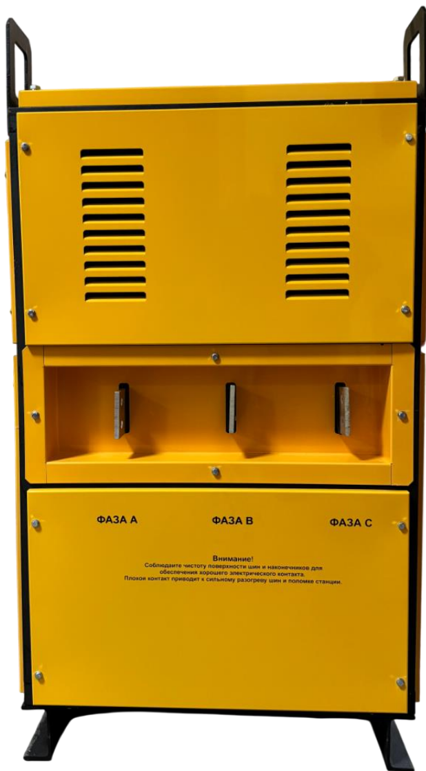
Рис. 2 Вид сзади