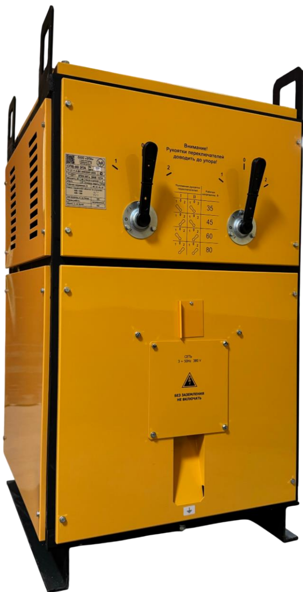
Рис. 1 Вид спереди