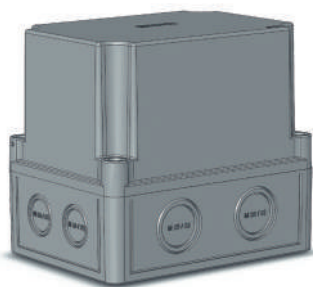
КР28XX -310; -311; -313; -610; -611; -613; -910; -911; -913