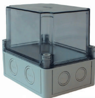
КР28XX -620; -621; -623; -920; -921; -923