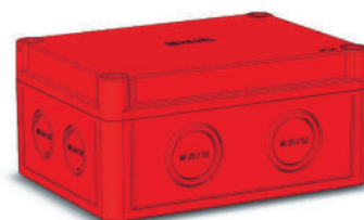
КР28XX -140; -141; -143; -440; -441; -443; -740; -741; -743