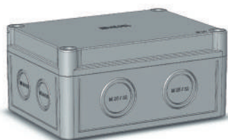
КР28XX -110; -111; -113; -410; -411; -413; -710; -711; -713

Также в ассортименте присутствует коробка КР2801-250, выполненная из полипропилена со степенью защиты IP44.