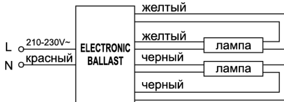
Рис. 3 Схема подключения ЭПРА EB53