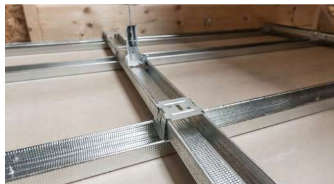
Монтаж соединителя для потолочного профиля