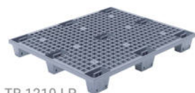
TR 1210 LP