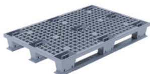
TR 1208 LPS