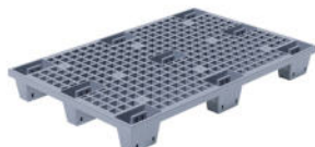
TR 1208 LP