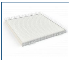
Защитная решетка для Dioga Office