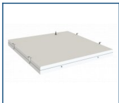
Комплект подвесов для Office IP65