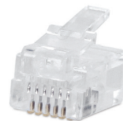
6P4C (код для заказа 7012с)