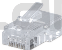
8P8C (код для заказа 7009с)