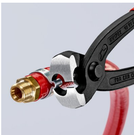
Герметичное крепление хомутом гибкого шланга на штуцере с помощью бокового носика для запрессовки