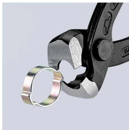
Применение фронтального носика для запрессовки