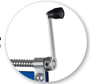
Регулировка центра тяжести