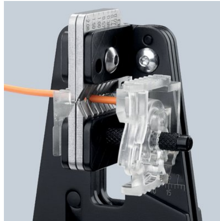
Ровное надрезание изоляции по всей окружности кабеля