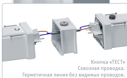
Кнопка «ТЕСТ» Сквозная проводка. Герметичная линия без видимых проводов.

*60 месяцев гарантии для светильника и 12 месяцев гарантии для блока аварийного питания