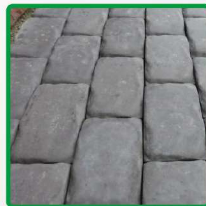
пол с препят- ствиями

возможно использование на любых поверхностях в помещении и на улице